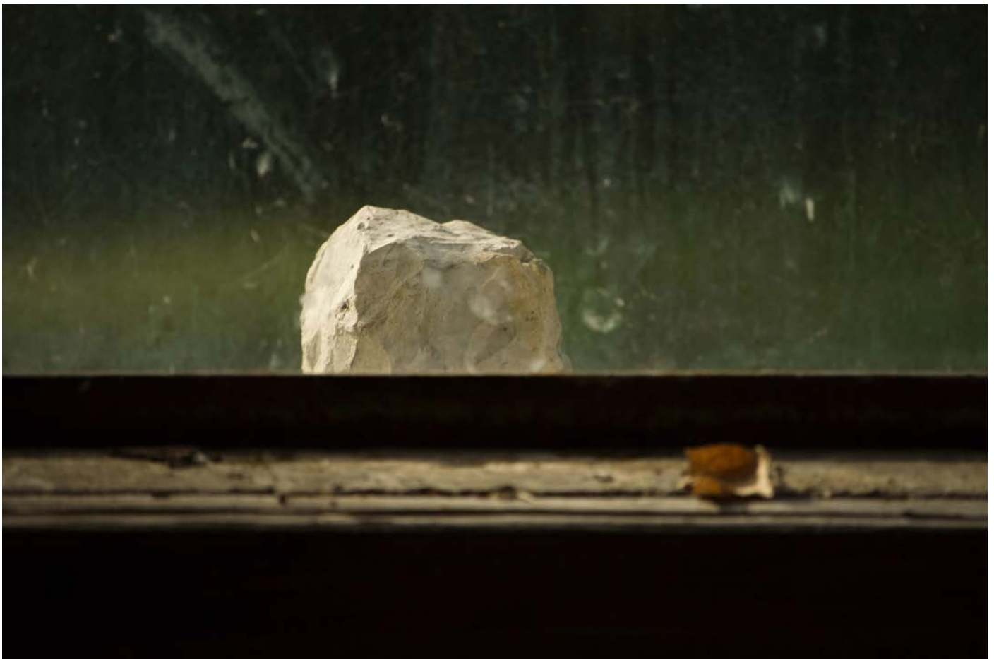
Illés Sarkantyu, Massacres, Pierre Tal Coat , 2015, tirage pigmentaire, 50 x 75 cm, 1/6

Vernissage Thursday November 3 / from 6 to 9pm