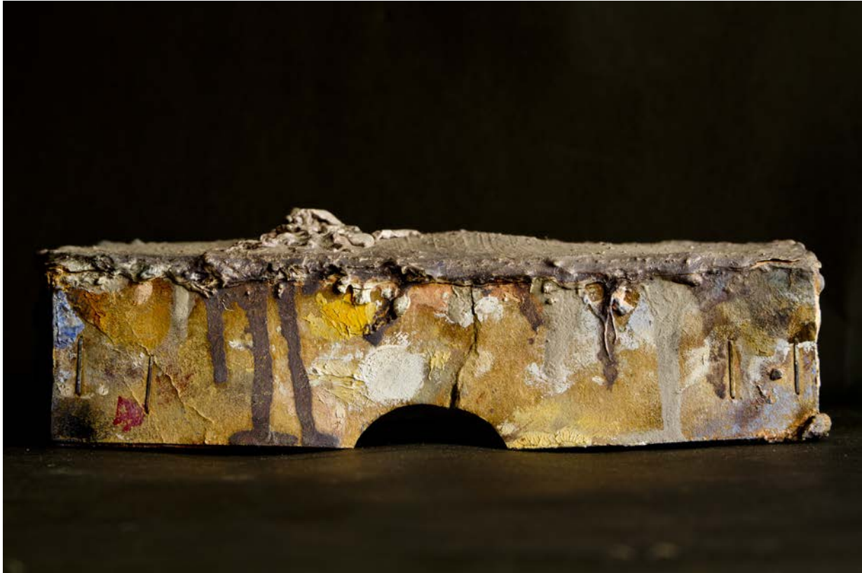
Illés Sarkentyu, Huile sur boîte à cigare , 2015, tirage pigmentaire, 50x75 cm, 1/6