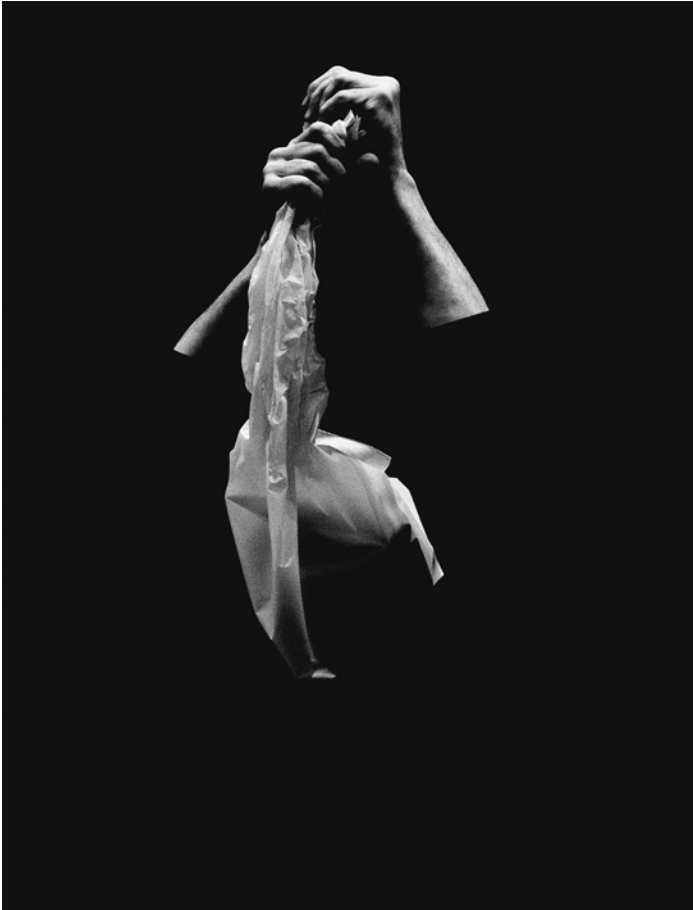
Illés Sarkantyu, Sho-bo-gen-zo, Josef Nadj , 2010, tirage pigmentaire, 230x70 cm, 1/6