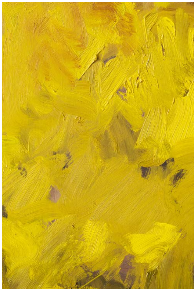
Illés Sarkantyu, Sans titre, Guy de Malherbe , 2016, tirage pigmentaire, 75x50 cm, 1/6

What is both bold and unsettling in this exhibition, is the presence of a certain amount of the originals that Sarkantyu founded his photographic work upon ; yet this interweaving does not really need to be justified or explained.