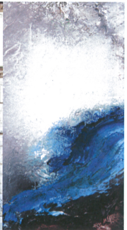
Françoise Bissara Fréreau Source Huile sur toile 23x15cm Galerie Jardins en art