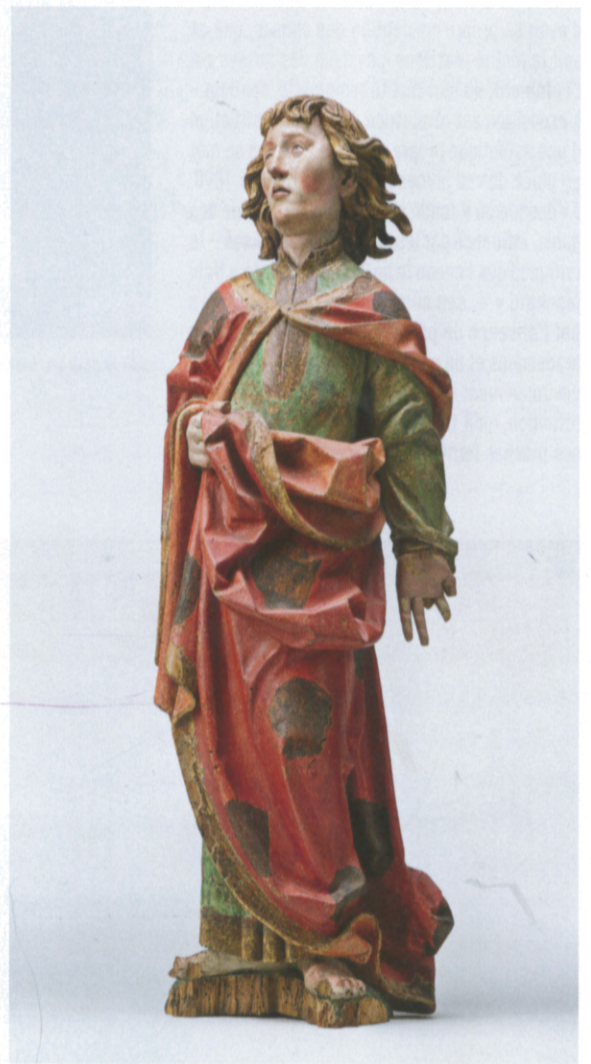
Saint Jean de Calvaire. Vers 1520, sud de la Souabe, tilleul polychromé, 78 x 25 x 15 cm. Musée de Cluny – musée national du Moyen-Âge, Paris.

La Souabe, ancienne région historique du Sud de l'Allemagne, fut le lieu d'une création abondante de sculptures religieuses entre les années 1460 et 1530, à l'aube de la Réforme protestante. Art majeur de la fin du Moyen-Âge dans l'Empire Germanique, ces sculptures, souvent peintes, relèvent d'un travail fin et prodigieux du bois de tilleul polychrome, caractérisé par des drapés minutieusement taillés, et provenant pour la plupart de retables d'autels démembrés. Le musée de Cluny offre avec cette exposition la possibilité de réunir ces pièces dispersées dans de nombreuses institutions françaises.