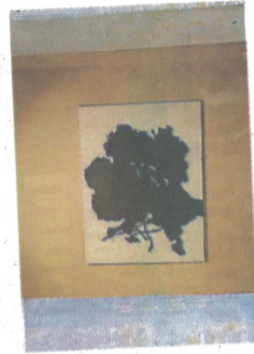
Arbre d'Alexandre Hollan.

Du 23 mai au 27 septembre , au château de Poncé-sur-le-Loir. http://chateaudeponce.com . Programme de l'inauguration, ce samedi 23 mai. À 14 h : ouverture au public. À 15 h 30 : discours. 16 h/17 h 30 : Trio Romain Pilon (guitare, contrebasse et batterie). Tarif pour samedi : 4 €. Puis 6,50 €, 4,50 € (réduit). Gratuit jusqu'à 12 ans.