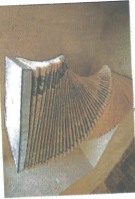
Œuvre de Bernadette Chéné.