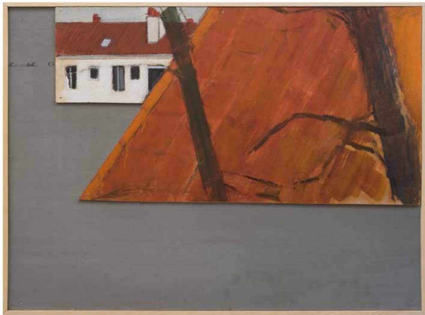
Pierre Buraglio, Rue du 19/4/43 , Peinture sur bois posée sur métal 56,5 X38 cm, 2013