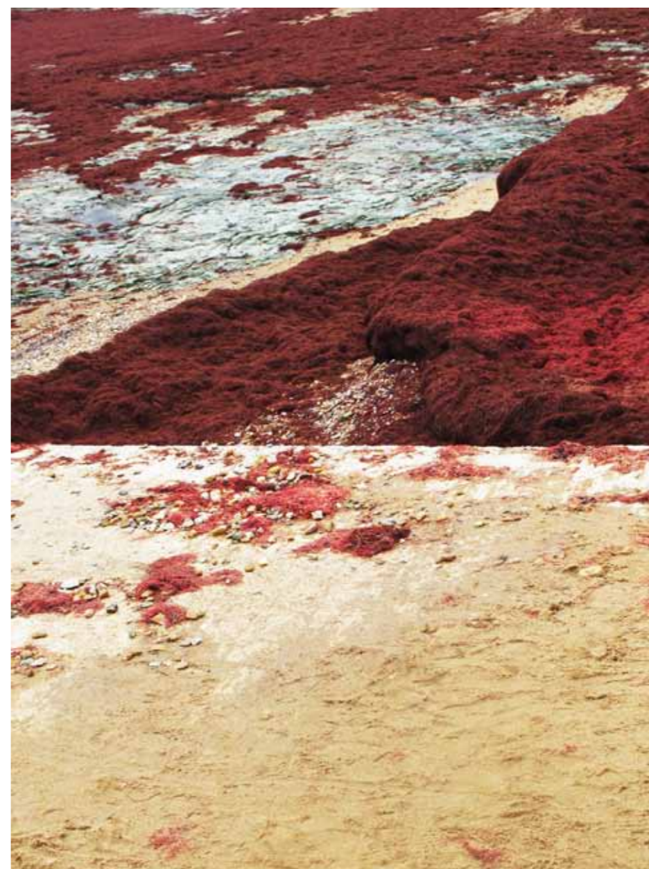
Sarah Le Guern, Sans Titre , 100 x 70cm, photographie tirage C-print sous diassec, 2013