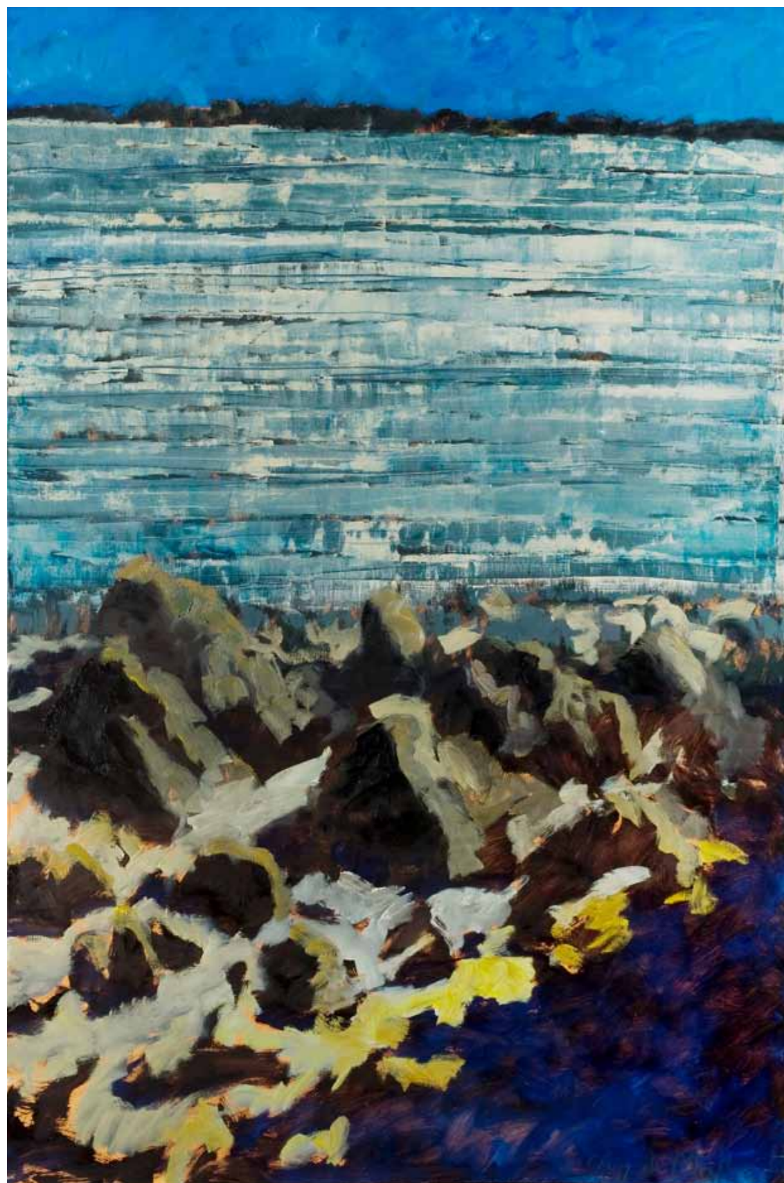
Guy de Malherbe, Sans Titre , huile sur toile, 130x195cm, 2013