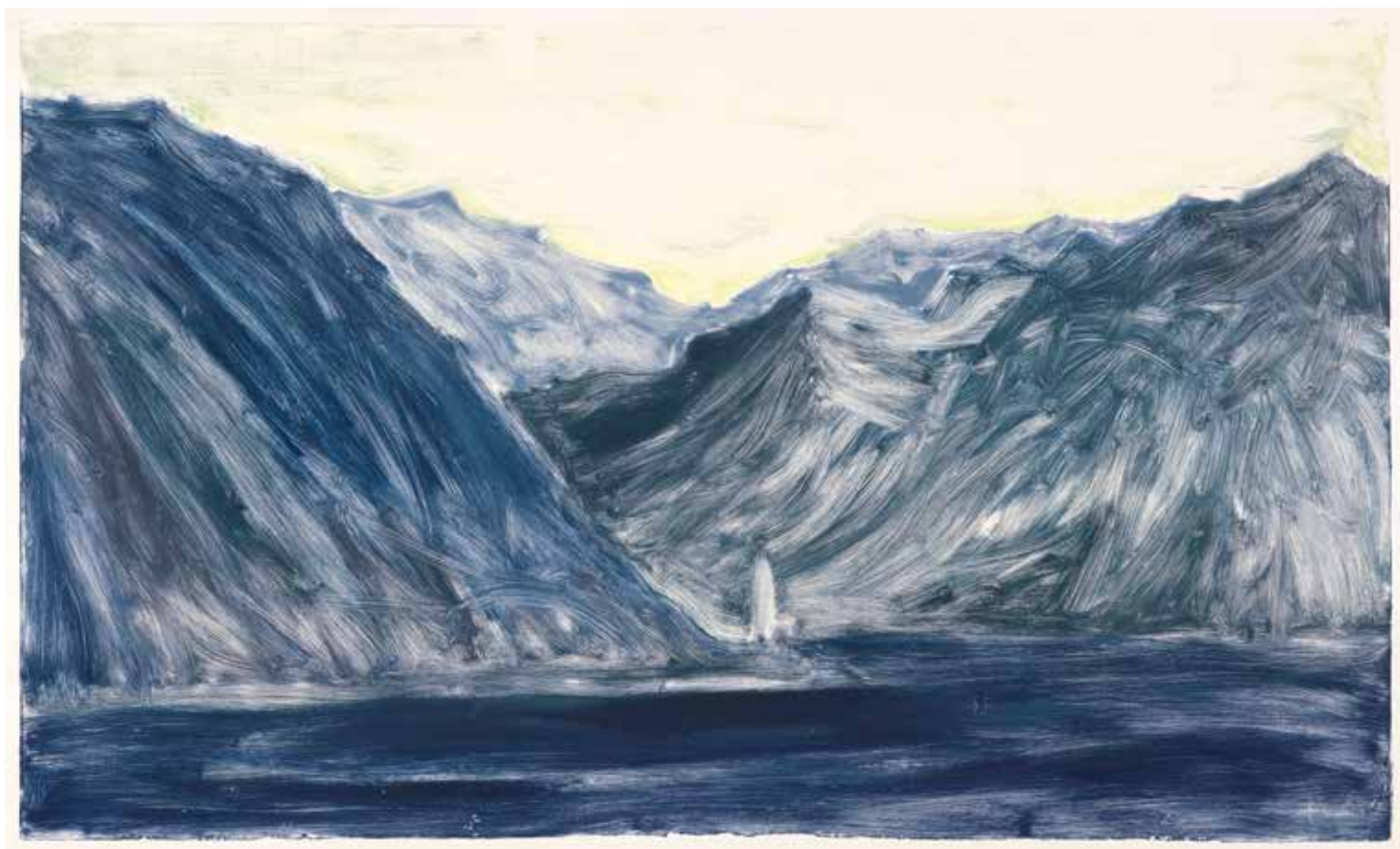
Le phare , Monotype, 86 x 138cm, 2012