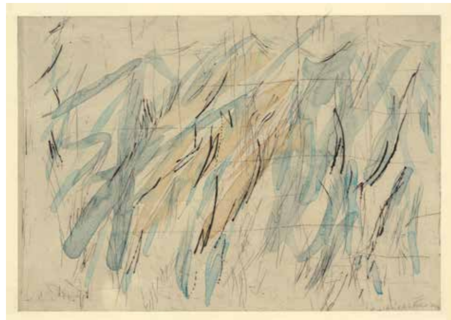
Variation n°I, Variation n°II, Variation n°III, Pointe sèche sur aquarelle Sur papier japon épreuve unique 54x39, 2013