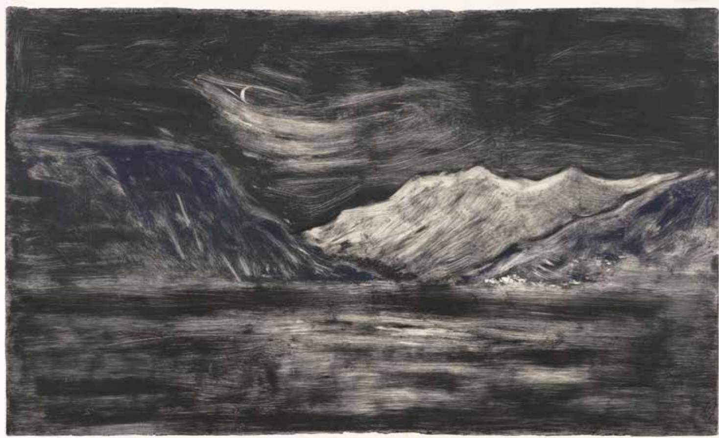
Nuit , Monotype, 86 x 138cm, 2012