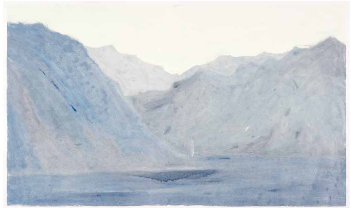
8h25 , Monotype, 86 x 138cm, 2012