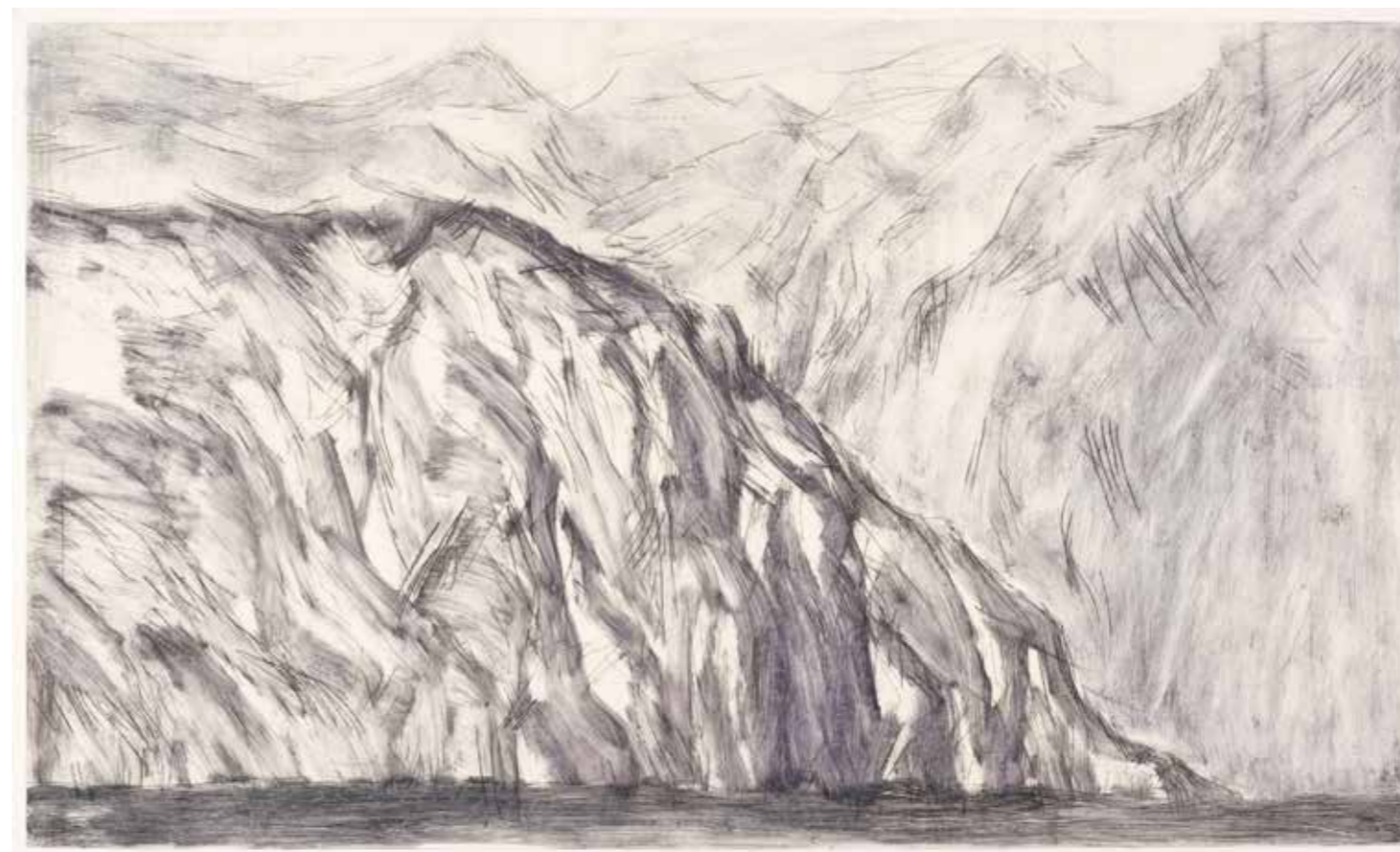
Variation n°III, Monotype et pointe sèche, 86 x 138cm, 2013